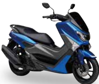
NMAX ABS (SE86J/SED6J)

●メーカー希望小売価格 (消費税8%含む) 329,400円 (本体価格 305,000円)