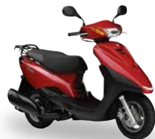
アクシストリート (SE53J) ※生産終了モデル

●メーカー希望小売価格 (消費税8%含む) 243,000円 (本体価格 225,000円)