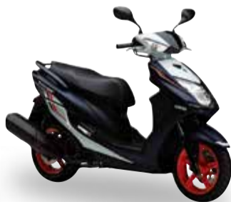
シグナスX SR (SEA5J/SED8J)

●メーカー希望小売価格 (消費税8%含む) 351,000円 (本体価格 325,000円)